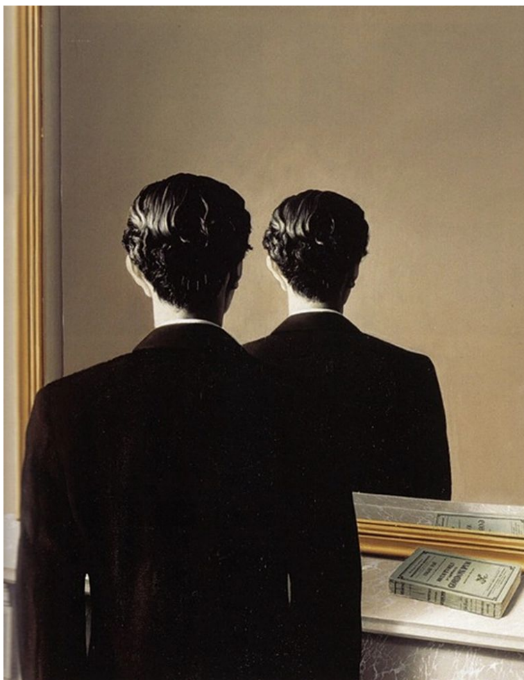
R. Magritte, L'Apparenza , 1925